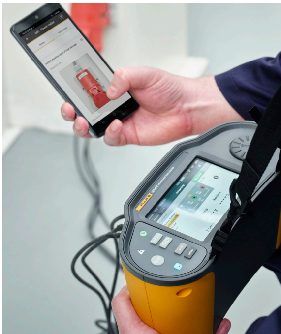
Přiřazujte fotografie přímo ke konkrétním testovacím bodům pro podrobnější dokumentaci