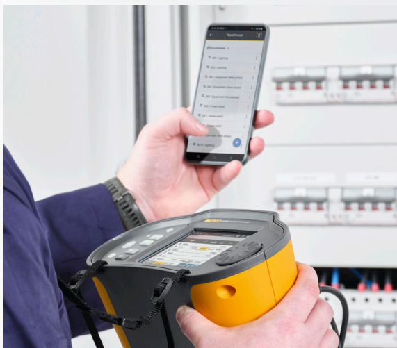
Omezení ručního zadávání dat a vedení záznamů