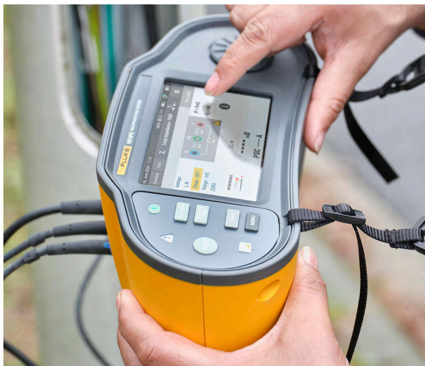
Plnobarevná dotyková obrazovka a dotykový otočný ovladač pro rychlé procházení nabídek

S řadou 1670 budete moci provádět požadované testy rychleji, zkrátíte čas strávený dokumentováním a budete mít přítom maximální důvěru ve shromažďovaná data.